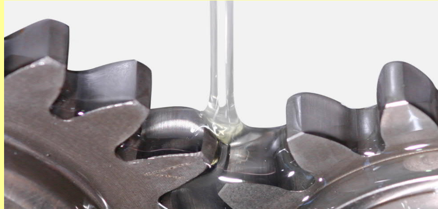
Tabelle D-abcg "Standard Öle für FLENDER Mining Truck Getriebe"

Table D-abcg 'Standard oils for FLENDER Mining Truck Gear Units'